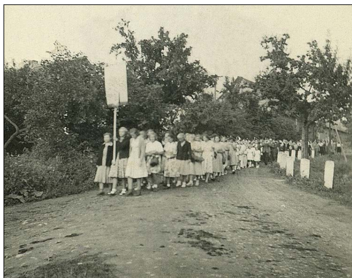
Procesí odbočuje z Chotýšan směrem ke kapličce „U Váňovného mlýna“.

Před tím, a to hned jak procesí ke Kapličce došlo, oddělil se od muzikantů jeden z nich a chvátal napřed. Dole pod kopcem v lese přešel dřevěnou lávku přes potok „Chotýšanku“ a postavil se na druhou stranu za potok s kloboukem v ruce. Bylo to takové jakési muzikantské právo, jakýsi nepsaný zákon a pokyn pro ty, kteří s procesím na Hrádek šli, aby určitým obnosem, vhozeným do nastaveného klobouku, velkým či menším, podle toho, jak kdo