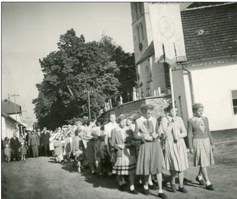
V čele procesí nese mládež standardu „Skupiny katolické mládeže“