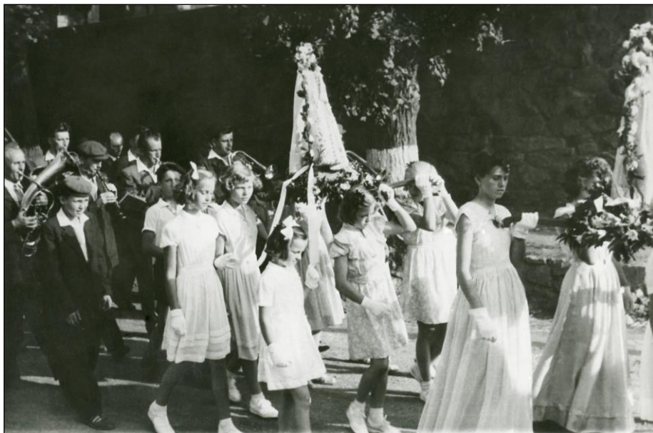
V roce 1958 vykročila z chotýšanské farnosti skupinka družiček se sochou P. Marie a hudebním doprovodem kapely JZD Takonín.

Už od dávných dob a to každého roku druhou neděli v červenci chodívali chotýšanští občané s procesím na Hrádek. Hrádecké poutě bývaly v našem kraji velmi známé a byly pořádány po deset neděl počínaje svátkem sv. Petra a Pavla koncem června.