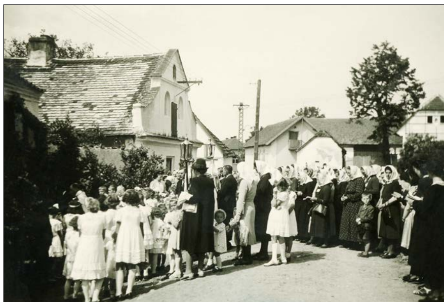
Další pobožnost se odbývá u postaveného oltáře u vrat statku Holejšovských č.p. 11.

V devět hodin dopoledne byla sloužena v kostele mše svatá, po ní pak se