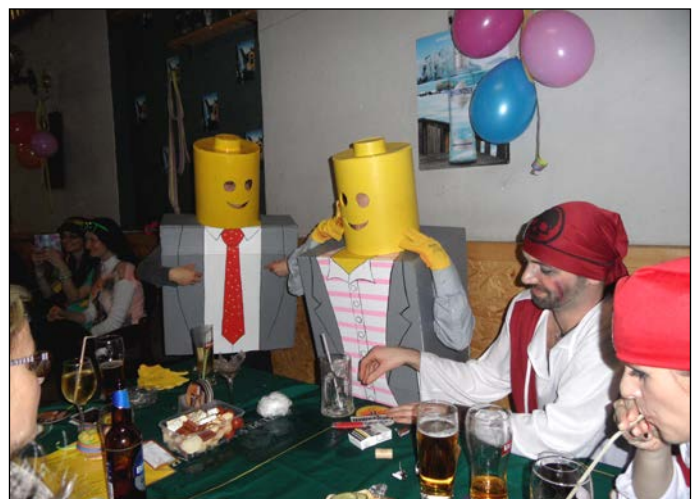
Foto: Miroslav Švarc /více ve fotogalerii 2017 na obecních stránkách www.chotysany.cz/