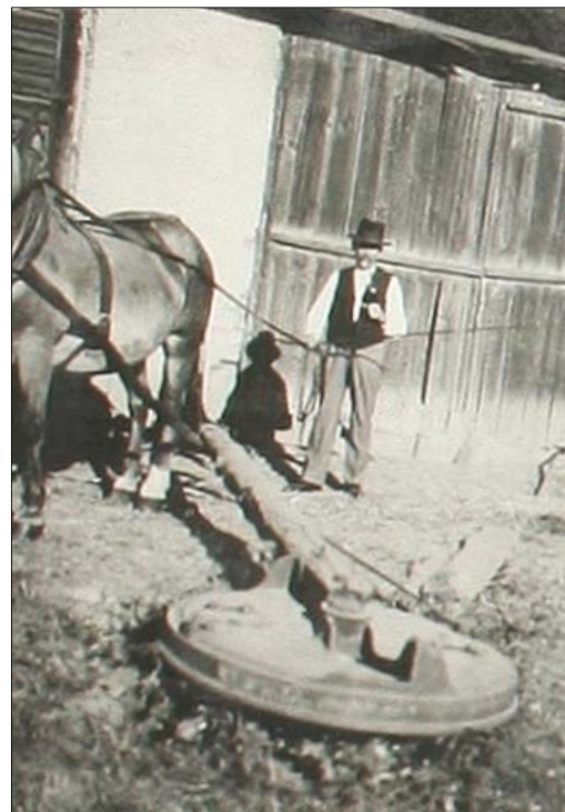
Žentour poháněný starou šimlů u Šimků za stodolou v roce 1950

Snad nikdy si neuvědomujeme celistvost velké lidské rodiny tak, jako na Vánoce. Neboť Vánoce jsou odjakživa svátky pokoje, míru a domova, a třebaže se lidé na celém světě různí v tisíci podrobnostech a třebaže představa lidského štěstí je v celém světě různá, mají všechny ty představy styčné body ve věcech nezákladnějších. Lidé na celém světě chtějí klid a mír. A také svobodu, a úctu ke člověku, neboť není míru bez jednoho ani bez druhého.