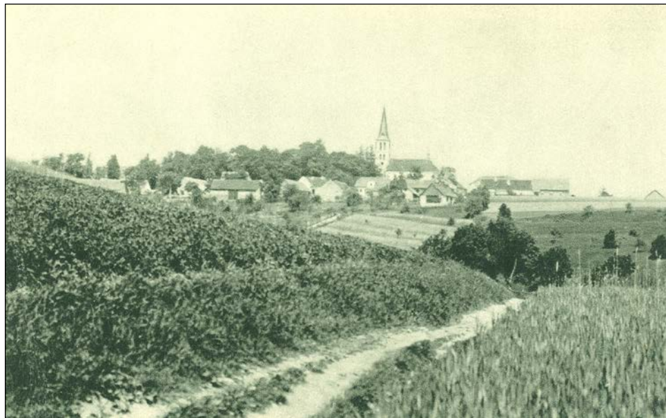
Cesta od rybníka Krabice do Městečka – pohlednice vydaná v r. 1948

v pomlázky vrbové proutí, vyparádili tyto pentlemi a hleděli těmito pomlážkami děvčatům našlehat. Děvčata se bránila - aspoň na oko - a také jen tak, aby se neřeklo, durdila: "Našlehají a ještě si za to dají zaplatit. O červené vajíčko prosíme!" Přesto, že po celý rok bývalo v naší vesnici dosti tanečních zábav, o pomlázce a to zvláště v dřívějších letech nebývala