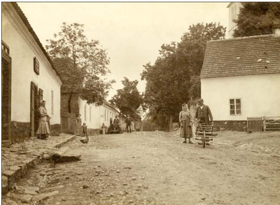
Východní pohled na část chotýšanské návse v roce 1913.

Dnes u nás na vesnici o harmoniku nikdo ani nezavádí ani nestojí, a když, tak jedině chromatiku, pianovku. Rádio, televizor a dnes již skoro všude zavedený místní rozhlas postačí úplně. Není v tom směru dnes už vůbec žádná ctižádost u mladých lidí na venkově po tom, aby uměli hrát na nějaký hudební nástroj, jak tomu dříve bývalo. Na kole tu jezdí dnes každý kluk i holka sotva začnou chodit do školy. Ti odrostlejší, co už školu vyšli a jsou někde v učení nebo pracují doma v zemědělství, mají jiný ideál, motorku - motocykl a tak pomalu i kolo, kdysi náš toužebný cíl je zatlačováno do pozadí. I ti malí prekové se opičí po těch velkých a místo všelijakých dětských her prohánějí raději merunu. Hrají fotbal, kopanou, ten prý tolik zdravý, ale jistě také i drahý sport. Jinak se už snad ani pobavit nedovedou.