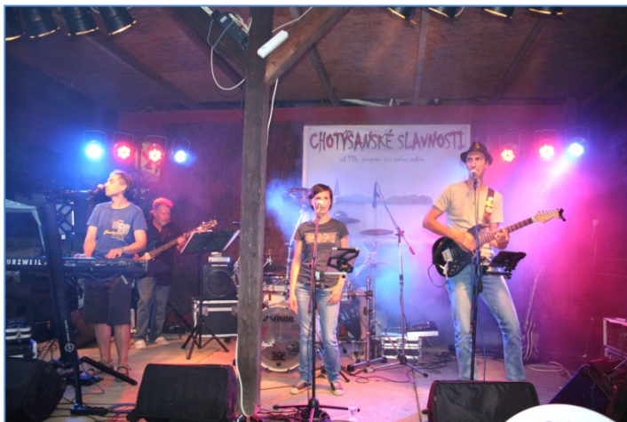
Kapela Generace rock

Již nyní pro vás tým organizátorů připravuje další, pátý ročník Chotýšanských slavností, kde bude opět spousta novinek a program pro celou rodinu. Příští ročník se uskuteční 23. 7. 2016, proto si již dnes zapište toto datum do kalendáře a příští rok opět v areálu fotbalového hřiště se na Vás bude těšit tým organizátorů.