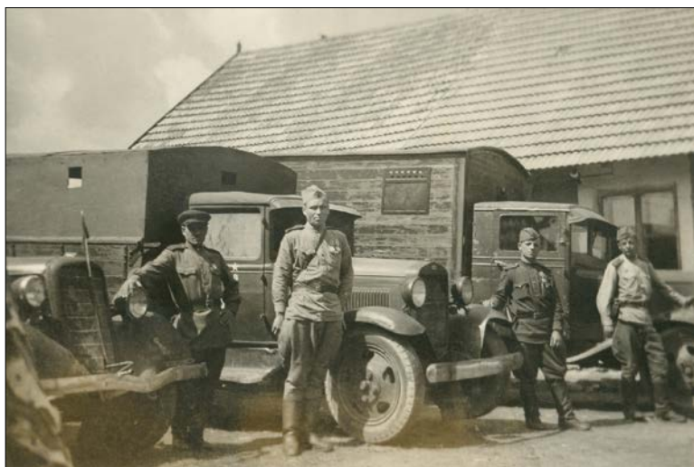
Sovětsí vojáci na dvoře koláře Škvora