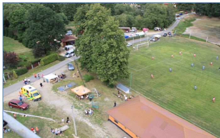
Pohled na sportovní areál z hasičské plošiny