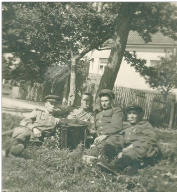
Veselá čtyřka u Tesků

Z pobytu vojáků Rudé armády u nás. Byli to vedle starých „kozáků“ i mladí „molodci“, kteří rádi zpívali, byli veselí a v celku velmi dobří. Měli zde i svou kapelu. V zámku byl ubytován štáb a často uspořádali v hostinci př. Matouška taneční zábavu. S našimi děvčaty si dobře zatančili a děvčata s nimi samozřejmě též!