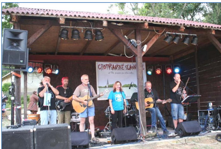
Trampoty - country kapela