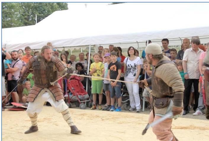
Okořská Garda - historický šerm