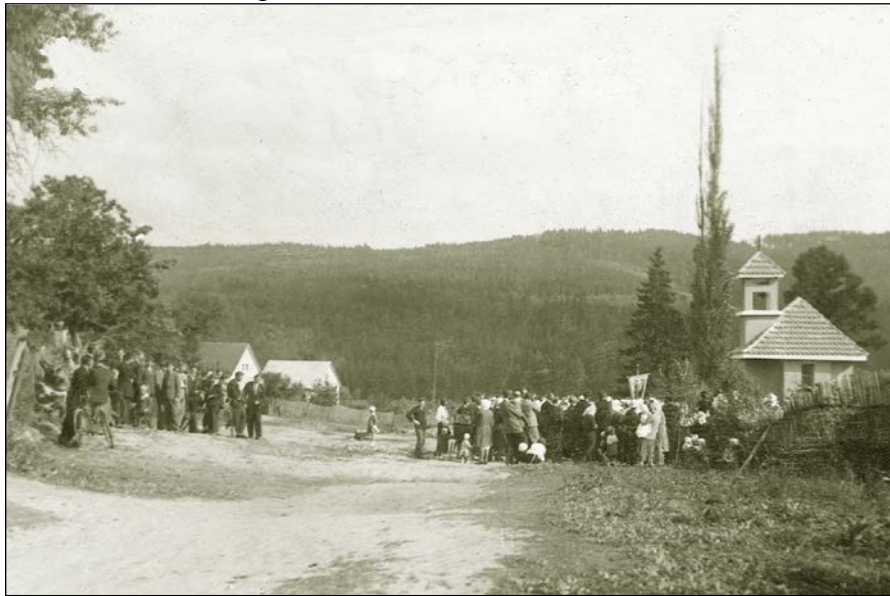
Svěcení kapličky na Pařezí dne 13. srpna 1934