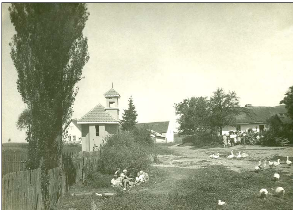
U kapličky na návsi kolem r. 1947

O kapličce na Pařezí jsem zaznamenal toto povídání na památku budoucím podle vyprávění přímého účastníka celé akce přítele Jendy Štěpánka z Pařezí čp. 1.