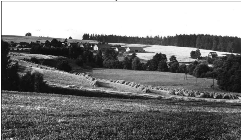
Pohled na Pařeží od Kojetic v r. 1969

Dostál míval s sebou také již nemladou ženu – družku, která s ním žila a při pletení košíků mu